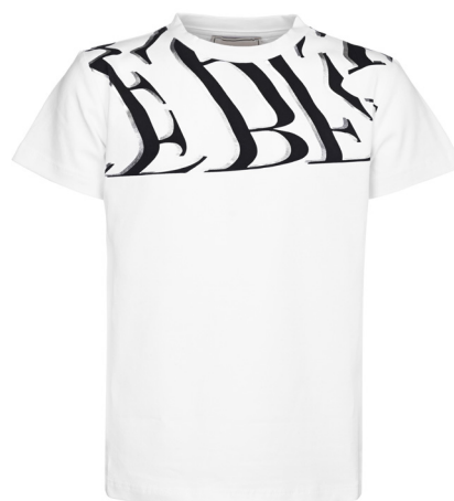
T-shirt iceberg manica corta cotone.