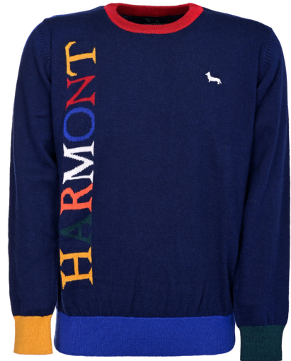
Girocollo finezza intarsio multicolor.