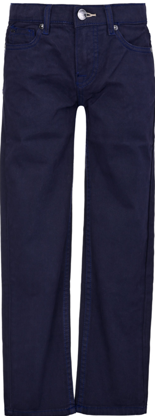
Pants 5t fit basic.