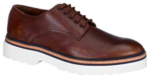
Scarpa english derby.