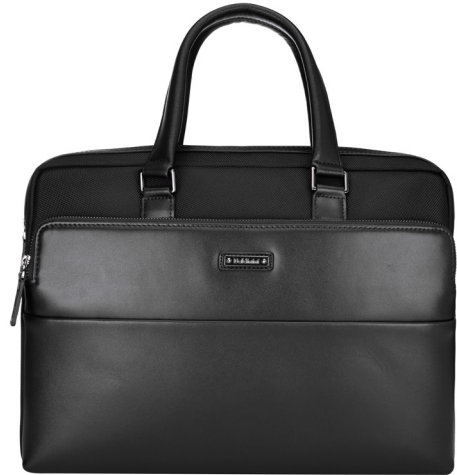
Professionale pelle tessuto.