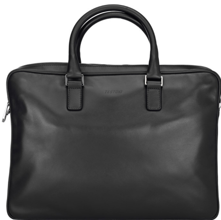
PC CASE Nero + Metallo scuro - Vitello liscio.