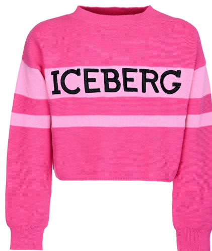
Maglione iceberg girocollo croptop.