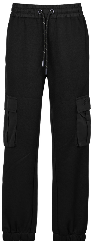
Pantalone iceberg in piquet cargo.