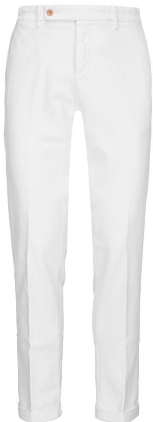
Pantalone chinos in caldo cotone.