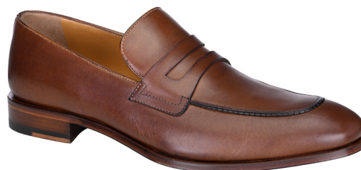
Loafer caramel - Caramello