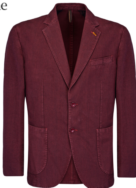
Blazer destrutturato con impunture a mano.