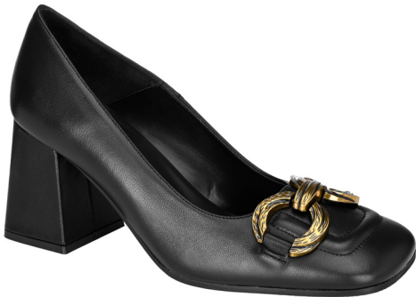
Decollette morsetto oro.