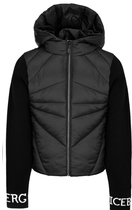
Piumino iceberg con manica in maglia.