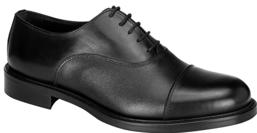
Francesina pelle saffiano.