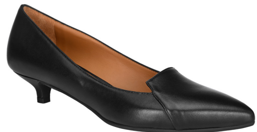
Pump black nero nappa.