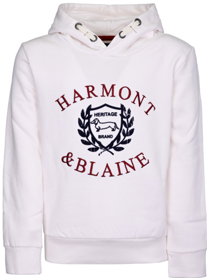
Felpa con cappuccio.