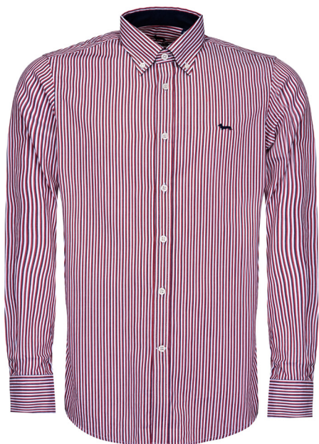
Camicia in tinto filo a 2 tessuti intrecciati.