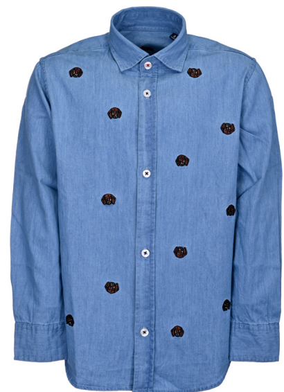
Camicia light denim con ricami all over.